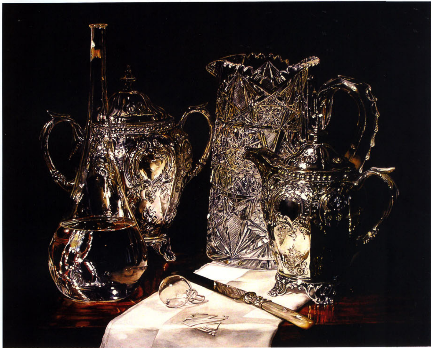
银和晶体(51cm x64cm) 劳林·麦克拉肯(Laurin McCracken) 美国