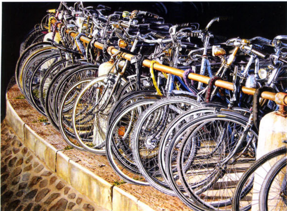
劳林·麦克拉肯作品 Laurin McCracken's Works